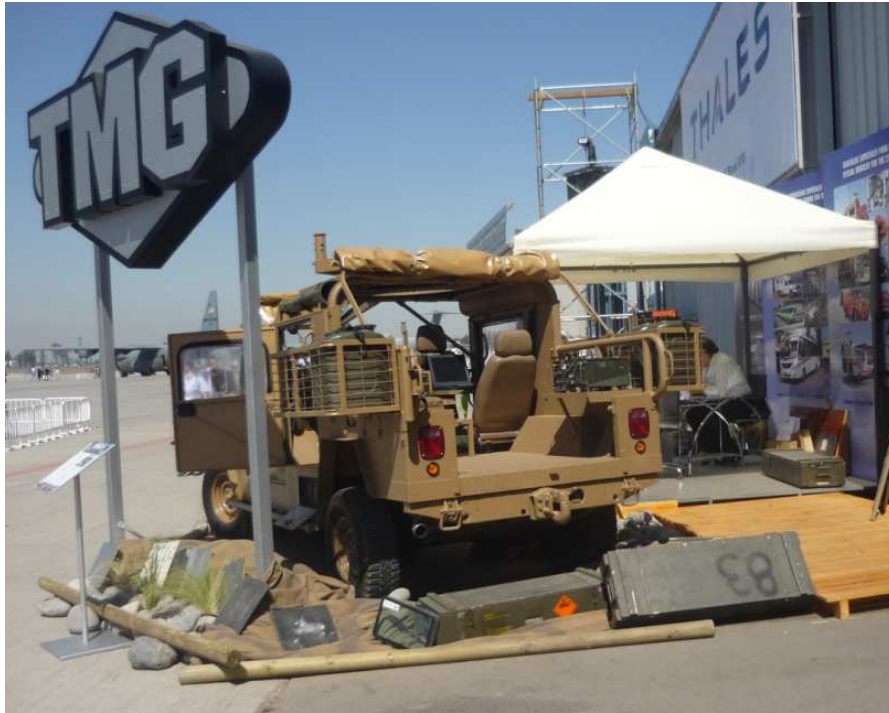
Stand Tecnology Motor Group

En sociedad estratégica con Tecnology Motor Group (TMG) , que es una empresa especialista en transformación de vehículos, se expuso por parte de Protección y Blindaje Austral Armour Engineering S.A. lo siguiente: