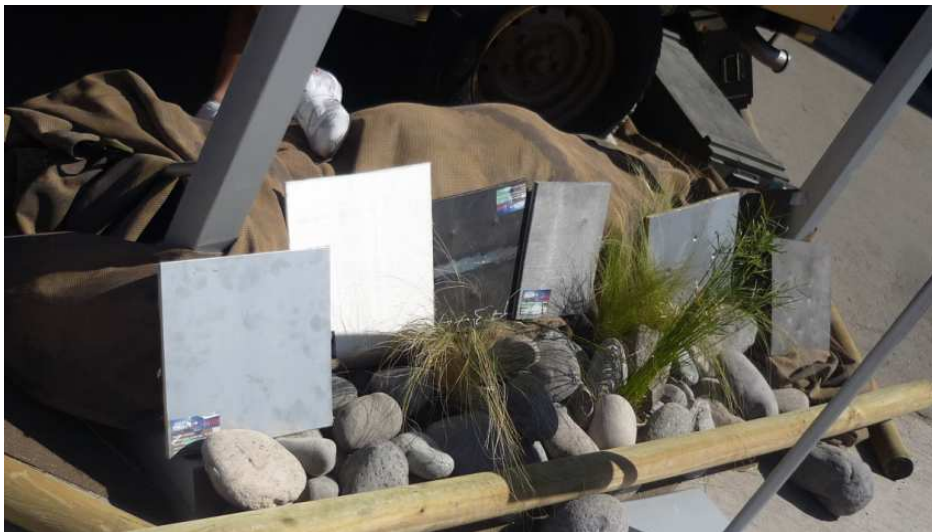
Probetas balísticas desarrolladas por Austral Armour Engineering S.A.