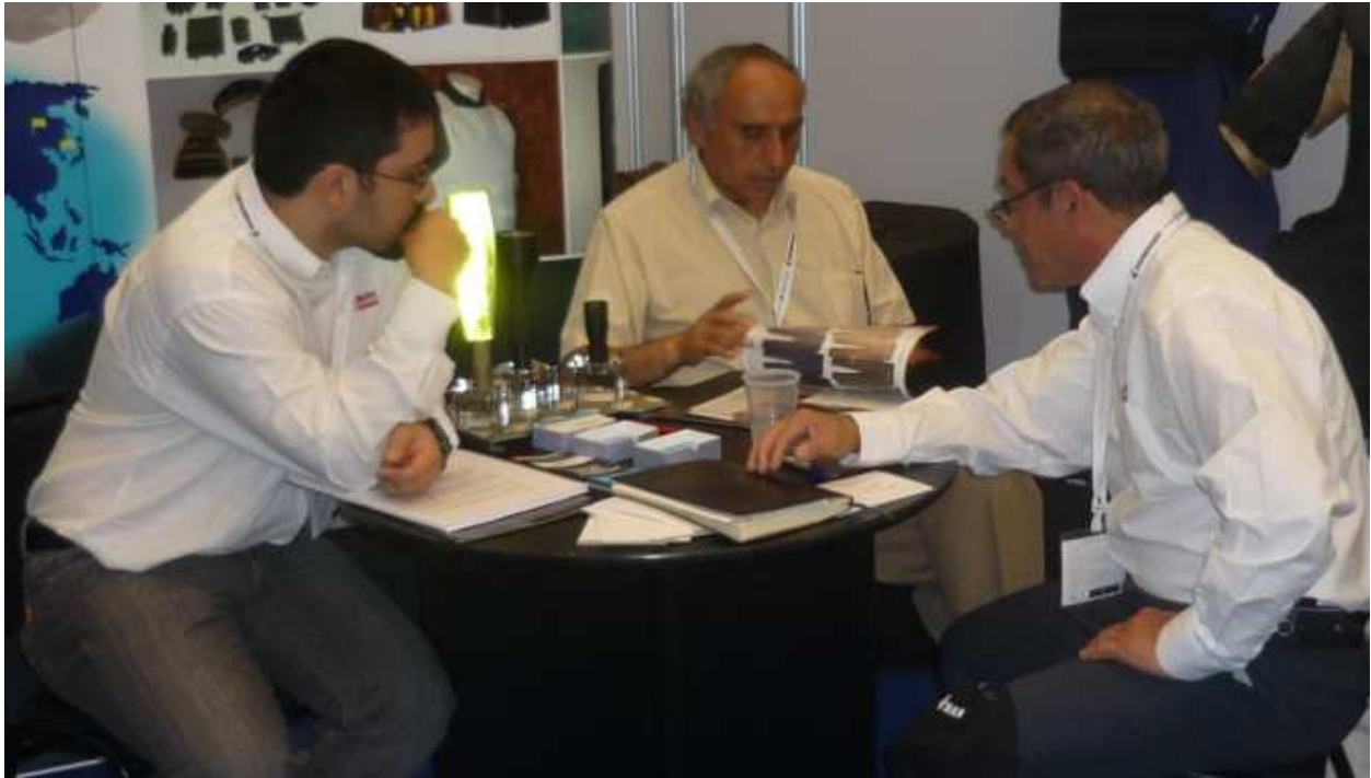
Set de linternas Barbolight

En Sociedad estratégica con BARBOLIGHT LIGHTING SYSTEMS Se mostró al público equipos lumínicos representada en Chile y Sudamérica nuestra empresa Protección y Blindaje Austral Armour Engineering S.A.