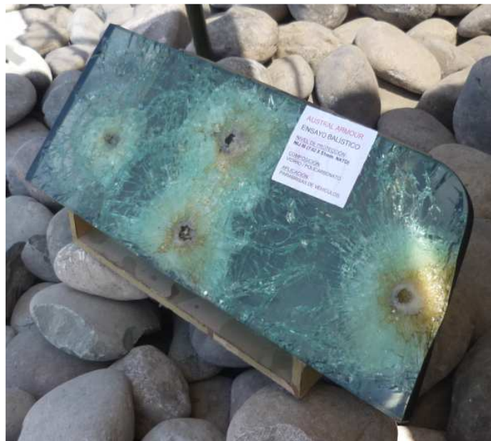
Impactos 7.62 NATO

En sociedad con AM General se facilitó un vidrio antibalas nivel de protección NIJ-III, con dimensiones especiales para vehículo HUMVEE.